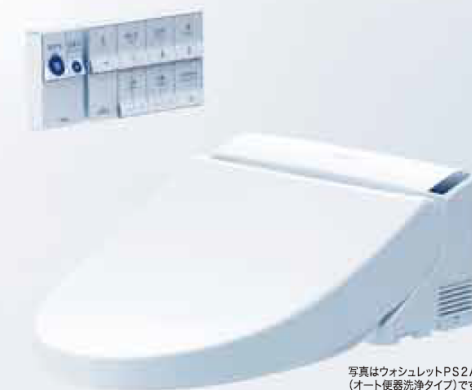
写真はウォシュレットPS2A (オート便器洗浄タイプ)です。

ボタンを押すと発電し、その電力でリモコンが作動。これまで必要だった乾電池交換や壁裏の電源工事が不要です。ウォシュレットのリモデルに最適です。